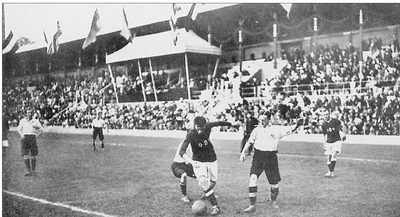
▲ Danmark kæmper mod England ved 1912-finalen i fodbold. 13 lande deltog, og Danmark sikrede sig plads i finalen ved at vinde først 7-0 over Norge, dernæst 4-1 over Holland. Englænderne var dog for stærke, og Danmark måtte nøjes med sølv efter at have tabt 4-2.