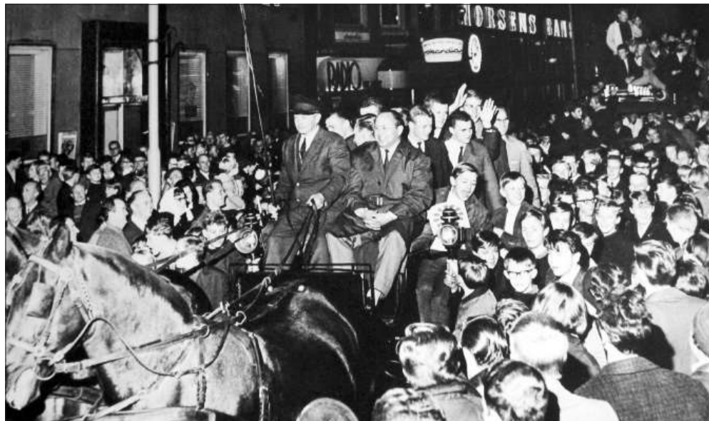
Da HfS i 1966 rykkede op i 1. division, blev de lokale spillere modtaget af 10.000-15.000 mennesker på Vitus Berings Plads. Holdet ankom med bus fra Frederikshavn, hvor en sejr på 2-0 havde sikret oprykningen. I charabanc med to heste gik turen gennem midtbyen til restaurant Lunden, hvor der var arrangeret oprykningsfest.