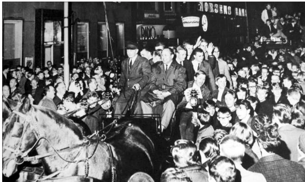
Da HfS i 1966 rykkede op i 1. division, blev de lokale spillere modtaget af 10.000-15.000 mennesker på Vitus Berings Plads. Holdet ankom med bus fra Frederikshavn, hvor en sejr på 2-0 havde sikret oprykningen. I charabanc med to heste gik turen gennem midtbyen til restaurant Lunden, hvor der var arrangeret oprykningsfest.