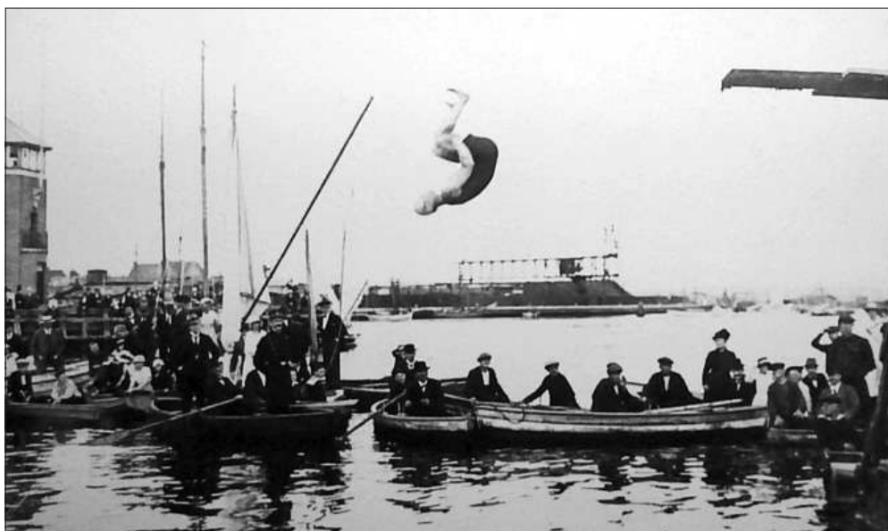
Fra 1917 til 1923 havde HfS en svømmeafdeling, der på sin vis blev afsættet til den nuværende Horsens Svømmeklub. Dengang kunne havnen bruges til opvisninger og konkurrencer som her udspring ved Jydsk Svømmestævne i 1918. Siden røg sporten ud i krise på grund af "fortvivlende badeforhold i Horsens", som det blev udtrykt. Det betød, at svømmeklubben nedlagde sig selv og først genopstod, da svømmehallen på Langmarksvej åbnede i 1972.