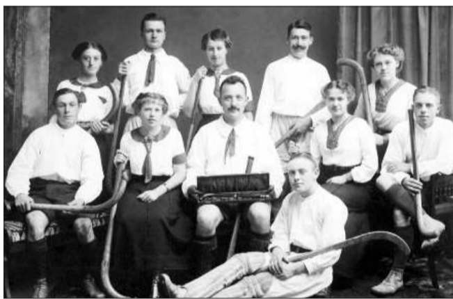
Lidt usædvanligt blandede hockey allerede i 1900-tallets begyndelse de to køn. HfS' velklædte hold vandt det jyske mesterskab tre år i træk: 1918, 1919 og 1920.