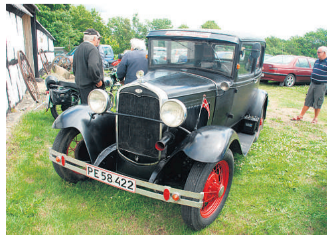
Søndag 20. august kan man bl.a. se veteranbiler på gårdmuseet Stjernholm i Nim. Pressefoto

Man kan smage på rygeost i haven, og der bliver bagt stjernholmvafler, som man kan købe. Der vil være åbent på gårdmuseet Stjernholm i Nim fra kl. 11 til 16 søndag 20. august.