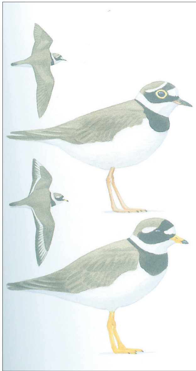
Et fint eksempel på illustrationernes effektivitet: Her vises forskellen på lille og stor præstekrave, både når fuglene ses på jorden og i flugt. Det er den lille præstekrave, der ses øverst.