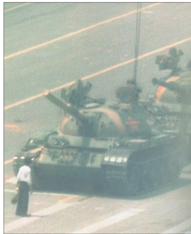
Billedet der bliver stående på nethinden. Den unge mand foran kampvognene under oprøret i Beijing 1985. Ingen ved, hvad der skete med manden i de følgende år. Men meget tyder på, at myndighederne ikke fandt frem til ham.

at køre manden ned? Svaret er, at ingen, heller ikke myndighederne, kan forklare det. Noget tyder på, at manden blev slæbt væk af bekymrede venner - og undgik at blive straffet senere. Men det vides ikke med sikkerhed. Derimod er Mette Holms bog en tankevækkende og farverig fortælling om en masse andet,