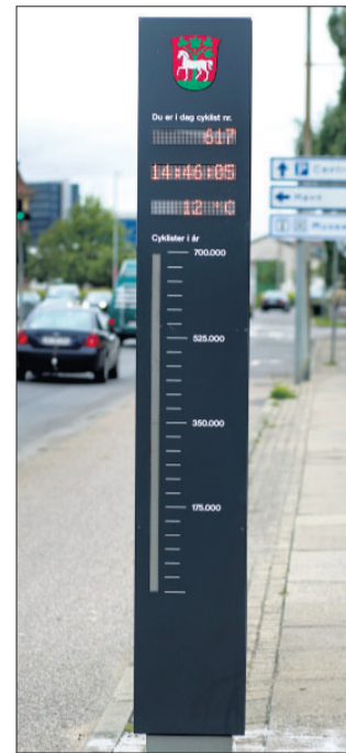
▲ Her på Niels Gyldings Gade skal frontpladen skiftes ud, så det samlede antal cyklister i barometret er på 400.000 i stedet for 700.000. Kun på Sønderbrogade skal tælleren gå til 700.000, da her vurderes at være flest cyklister.

légade tælles cyklisterne i øjeblikket slet ikke, da her mangler spoler i cykelstien i begge sider af vejen. Andre steder er tællerne leveret med forkerte frontplader, hvor man kan se det samlede antal cyklister. Sønderbrogades tæller går op til 700.000, mens den på Byggholm Parkvej kun går til 200.000.