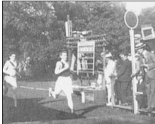
▲ Der findes ingen billeder fra 400 m-finalen ved OL 1900, men derimod et fra 800 m-finalen på græsbanen i Boulogne-skoven. Her vandt englænderen Alfred Tysoe. Han døde året efter af lungebetændelse. Ligesom Ernst Schultz opnåede han kun at blive 27 år.