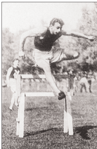
▲ Alvin Kraenzlein, USA, blev guldvinder i både 110 m og 200 m hækkeløb i Paris 1900.

► Bogen „De olympiske - Biografi af danske OL-deltagere 1896-1996“; Wikipedia; hjemmesiden Sports Reference / Olympic Sports; Boldklubben B93's hjemmeside; dagbladet Politikens avisarkiv; Danmarks Atletik Forbund (dafital.dk).