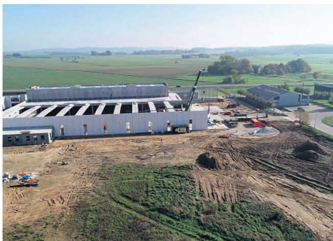
Udvidelsen ligger i forlængelse af den eksisterende fabrik, så Vola får nu 250 meter facade ud mod Vejlevej.