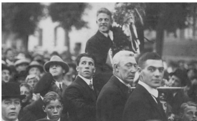
HORSENS FØRSTE OLYMPISKE MEDALJEVINDER, BOKSEREN THYGE PETERSEN, MODTAGES I HORSENS EFTER AT HAVE VUNDET SØLVMEDALJE I LETSVÆRVÆGT VED OL I PARIS 1924.