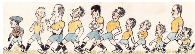
DEN GULE FARE 1927 I JOHS. B. TORBENSENS STREG