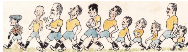
DEN GULE FARE 1927 I JOHS. B. TORBENSENS STREG