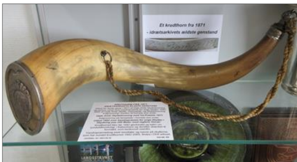
Et krudthorn fra 1871 er idrætsarkivets og DGI Lokalarkivs ældste genstand.

Horsens og Omegns Gymnastikforening, Horsensegnens Gymnastikforening, Horsensegnens Gymnastik- og Ungdomsforening samt DGI Horsenseggen.