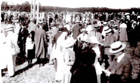
Derby-stemning på Bygholm Marker. Billedet er fra væddeløbet 8. juli 1917.

Her fortælles om, hvordan "hele Byen og hele Egnen tog Del", da det første væddeløb fandt sted i 1912. "Horsens-Bladene bragte en efter Datidens Forhold meget omfat-